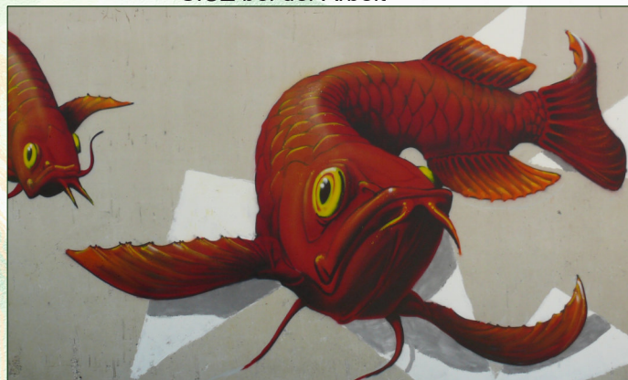
Beispiele für Wandbilder der Künstlerin; Abstrakte Formen und ein Motiv aus der Tierwelt